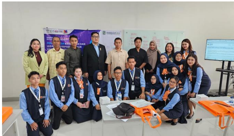
Gambar 2. Narasumber, Peserta PKM dan Mahasiswa

Kemudian terakhir melatih para UMKM memperhitungkan pemahaman tentang biaya logistik, yang merupakan biaya yang timbul dalam proses distribusi produk atau jasa dari tempat produksi ke tempat konsumen. Hal ini mencakup biaya pengiriman, penyimpanan, dan pengelolaan rantai pasok yang efisien. Selain itu, melatih UMKM juga memerlukan pemahaman tentang biaya perawatan fasilitas, yang meliputi biaya yang timbul dalam pemeliharaan dan perbaikan fasilitas bisnis mereka. Dengan memberikan pemahaman yang komprehensif tentang setiap komponen biaya operasional ini, UMKM dapat memahami dengan lebih baik bagaimana mengelola keuangan mereka dan membuat keputusan yang lebih cerdas dalam menjalankan bisnis mereka.