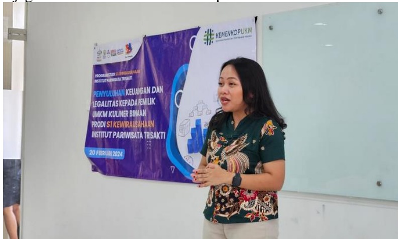
Gambar 1. Kegiatan Penyuluhan

Kemudian melatih UMKM dalam memahami berbagai jenis bahan kemasan juga krusial. Ini termasuk kemasan plastik yang sering digunakan karena kemampuannya untuk melindungi produk dari kelembaban dan kontaminasi, kemasan kertas yang umum digunakan untuk kemasan makanan ringan, kemasan logam yang kuat dan tahan lama, serta kemasan kayu yang memberikan nuansa alami dan kekuatan struktural yang baik. Selain itu, perlu ditekankan bahwa pembuatan kemasan perlu memperhatikan tidak hanya bentuknya, tetapi juga desain dan labeling yang akan ditampilkan. Ini penting untuk menarik perhatian konsumen dan menciptakan citra merek yang kuat untuk produk makanan dan minuman UMKM. Dengan memahami secara menyeluruh berbagai aspek pengemasan ini, UMKM dapat meningkatkan daya saing mereka di pasar dan menjaga kualitas serta keselamatan produk mereka.