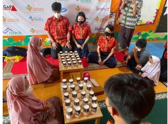
Sesi Game 1