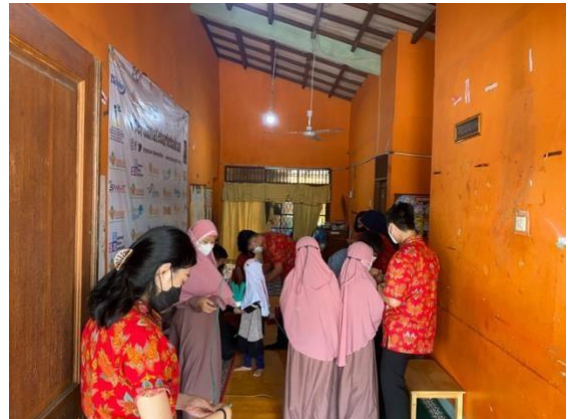
Sesi Game 2