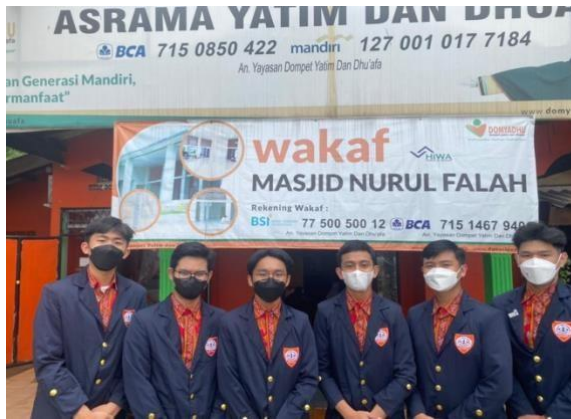
Sesi Foto Panitia Pria