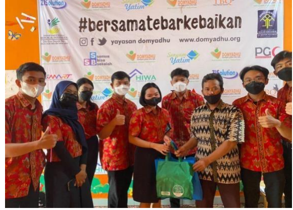
Sesi Pembagian Sembako