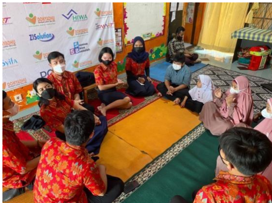
Sesi Pengajaran Pembersihan Area Tempat Tidur