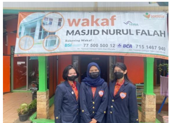
Sesi Foto Panitia Wan