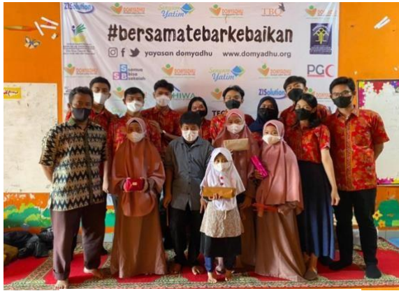
Sesi Pembagian Hadiah dan Foto Bersama