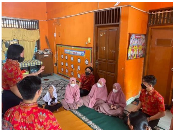
Sesi Pengajaran Perkenalan Bahasa Inggris